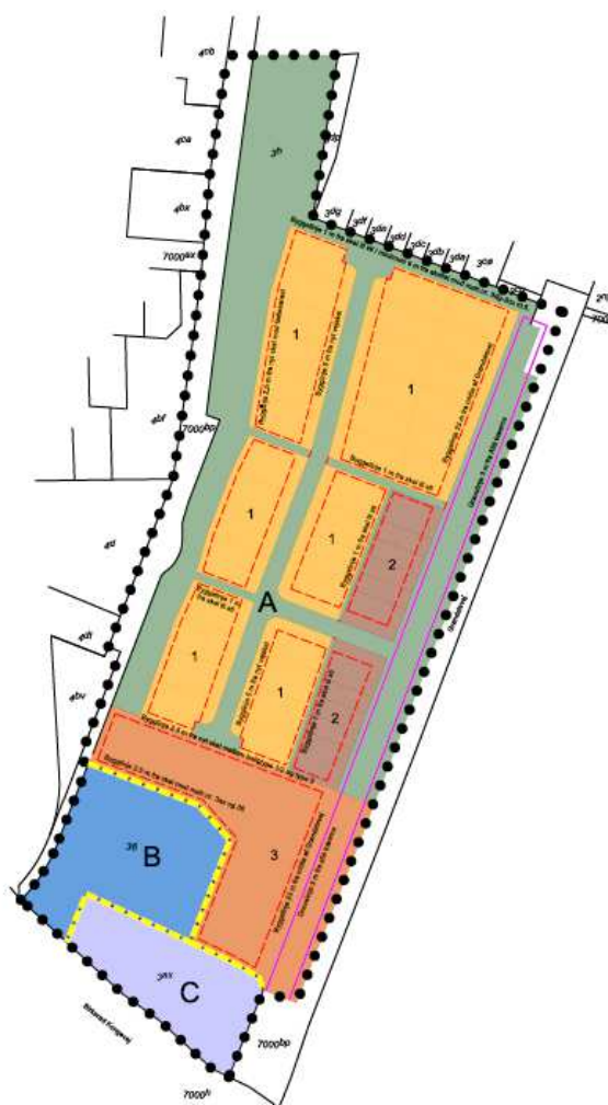
Figur 4.1 Kortudsnit 261 fra lokalplan

Bassinet anlægges hvor der før 1968 var en naturlig sø. Denne sø blev opfyldt og afdrænet i 1968.